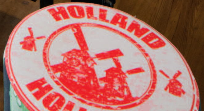
Glastisch H 16922